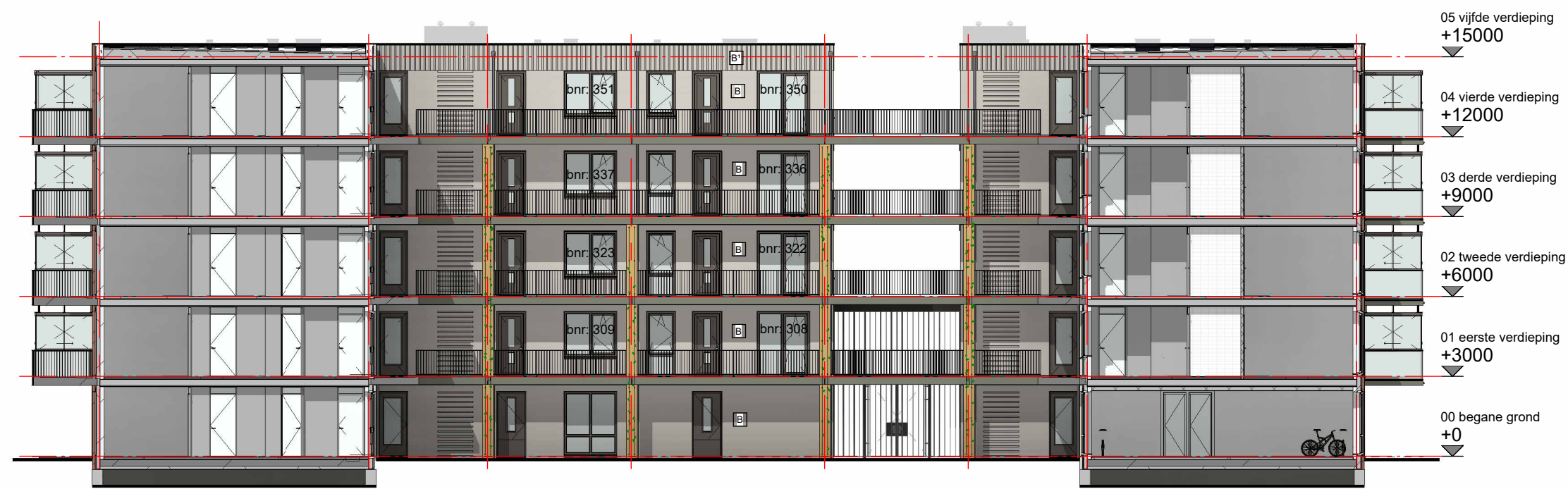
Linker zijgevel binnenzijde