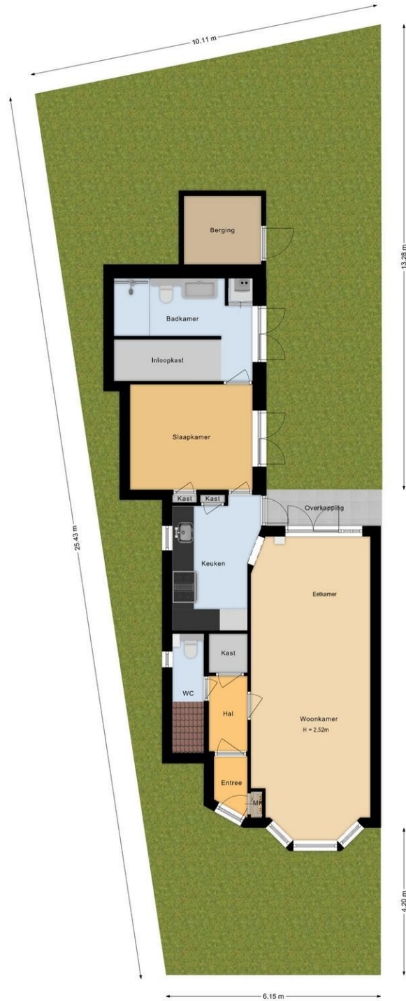
Centaurusstraat 20 Zwart Haarlem Situatie